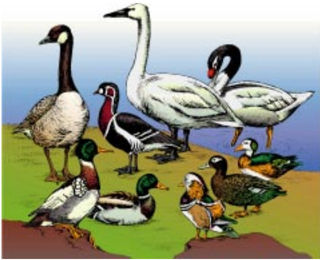
Abb. 2: Die Entenartigen als Beispiel für einen Grundtyp. Zu einem Grundtyp gehören alle Arten, die direkt oder indirekt (über eine dritte) Art kreuzbar sind (also Mischlinge bilden können).