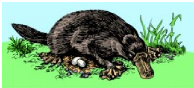
Abb. 4: Paßt nicht gut in einen Stammbaum: Das Schnabeltier vereinigt in sich Säugermerkmale (Milchdrüsen, Haare), Reptilienmerkmale (legt Eier) und ein vogelähnliches Merkmal (Hornschnabel). Als Spezialität besitzt es als wasserlebendes Tier außerdem einen Ruderschwanz und Schwimmhäute.

Die hier kurz geschilderten Argumente werden in „ Evolution – ein kritisches Lehrbuch “ ausführlich behandelt.