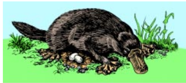
Abb. 4: Paßt nicht gut in einen Stammbaum: Das Schnabeltier vereinigt in sich Säugermerkmale (Milchdrüsen, Haare), Reptilienmerkmale (legt Eier) und ein vogelähnliches Merkmal (Hornschnabel). Als Spezialität besitzt es als wasserlebendes Tier außerdem einen Ruderschwanz und Schwimmhäute.

Die hier kurz geschilderten Argumente werden in „ Evolution – ein kritisches Lehrbuch “ ausführlich behandelt.