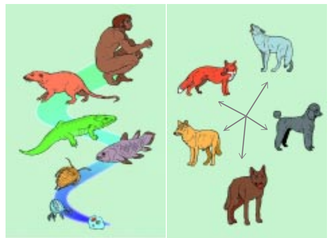
Abb. 1: Mikro- und Makroevolution sind grundverschiedene Konzepte. Mikroevolution ist Variation vorhandener Konstruktionen (innerhalb von Grundtypen), Makroevolution ist die Entstehung neuer Konstruktionen.

Wichtig ist in diesem Zusammenhang: Die üblichen Lehrbuchbeispiele für das beobachtbare Wirken von Evolutionsprozessen (durch Mutation, Selektion usw.) sind ausschließlich Beispiele für Mikroevolution (z. B. Darwinfinken, dunkle Form des Birkenpanners, Giftresistenzen, Züchtung usw.)